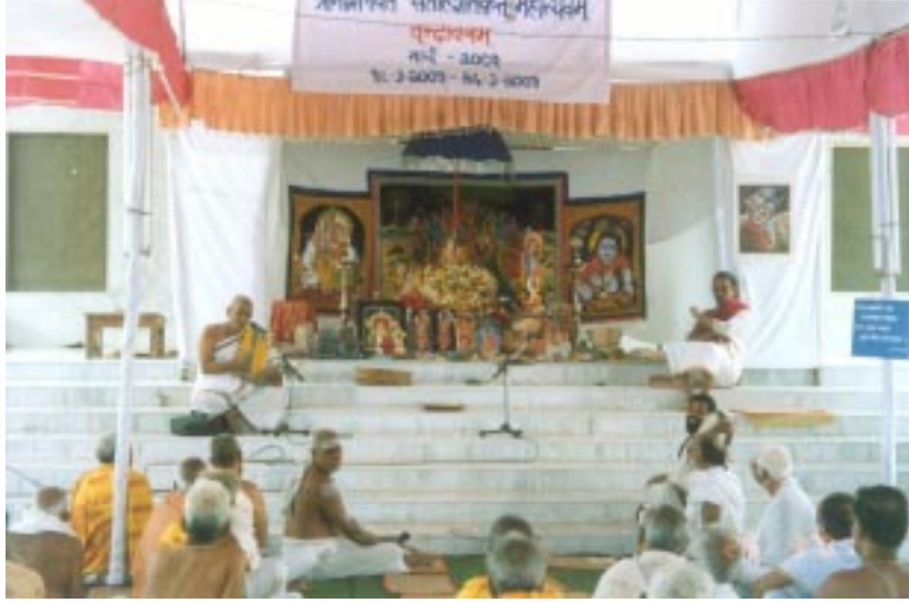
பூமீத் பாகவத ஸப்தாஹு ஸதக்ரது பூர்த்தி நாள் அன்று (24-3-2001) நடைபெற்ற வித்வத் ஸதஸ்.